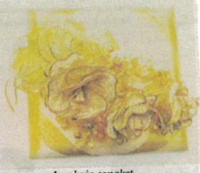
Bunga pahar kain songket.